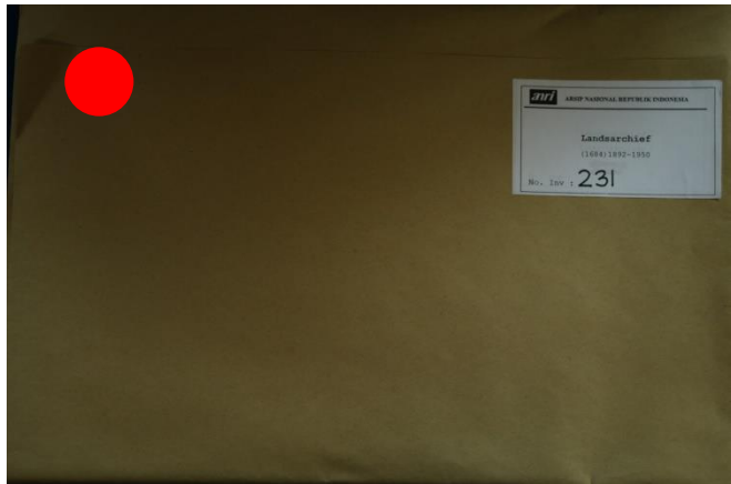
Sampul Arsip Bersifat Tertutup

KEPALA ARSIP NASIONAL REPUBLIK INDONESIA,