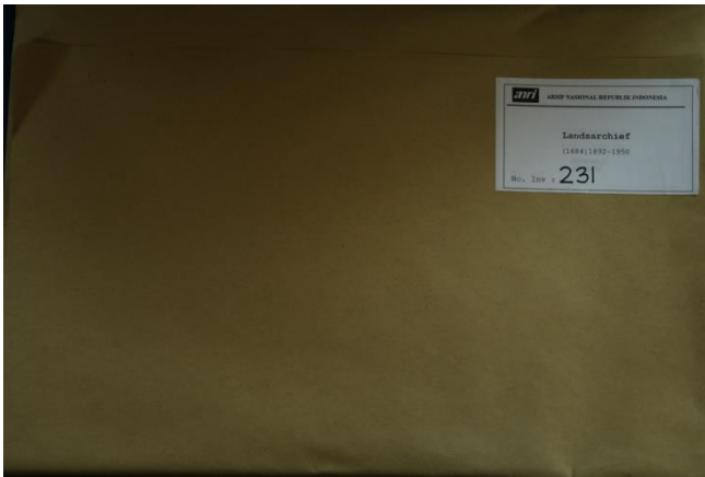
Sampul Arsip Bersifat Terbuka